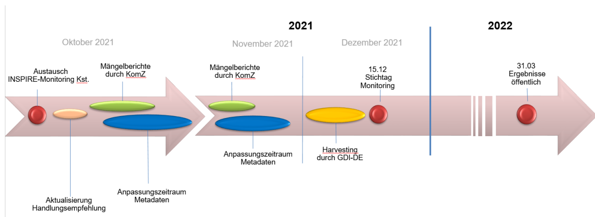
Abbildung 2: Zeitplan für das Monitoring für das Berichtsjahr 2021.

GDI-BW Partner, welchen Ihren Katalog an den MDK GDI-BW angeschlossen haben (OGC CSW 2.0.2 Schnittstelle), sollten die Laufzeiten mit einrechnen, welche durch die vereinbarten Harvesting-Zyklen betriebsbedingt auftreten.